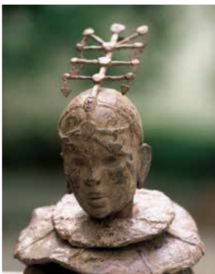
Sculpture Marine DE SOOS - Jardin des sculptures de Bois-Guilbert