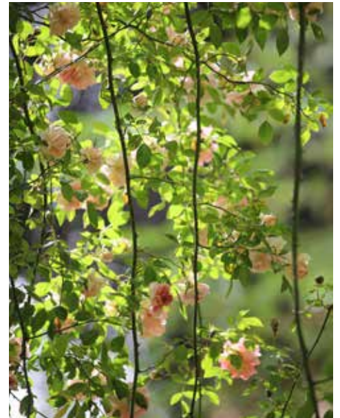
Jardin des Sculptures ©Jean-Marc de PAS