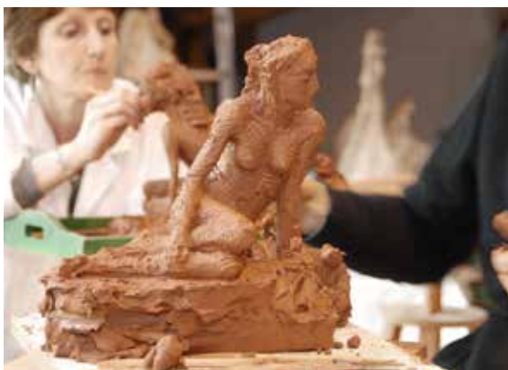
Atelier Modelage