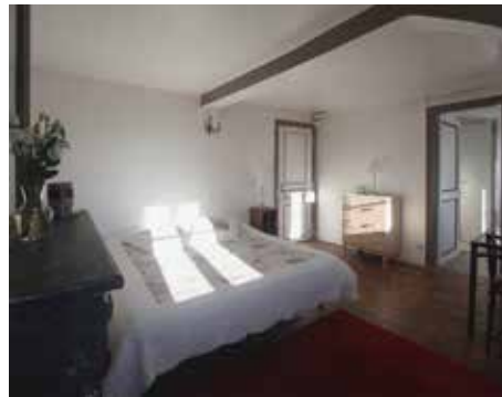
Meublé - Château de Bois-Guilbert Sud