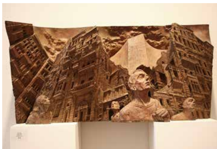
Sculpture Paul DAY - © Paul DAY

Parmi ses travaux les plus célèbres, on peut compter ses hauts-reliefs composants des frises narratives comme The Battle of Britain Monument à proximité de Big Ben (2005) ou encore The Queen mother Memorial situé près du Buckingham Palace (2009). Il est l'auteur de l'iconique The meeting place en 2007 à la Gare de Saint Pancras à Londres.