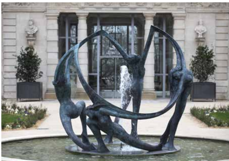
Ronde des Saisons, installée en mars 2020 - Lauréat Concours à Sucy-en-Brie (94) - Jean-Marc de PAS

« Intervenir sur un site n'est pas une action neutre. La création entre en dialogue avec la vocation des lieux, avec son histoire et les éléments formels, paysages, architectures, qui le composent. Elle vient s'ajouter et en ce sens doit trouver sa cohérence aux yeux des personnes qui vivent cet espace. L'artiste intègre un cahier des charges pour produire un geste poétique qui va au-delà de la matérialité de l'œuvre. Une œuvre peut apporter un supplément d'âme à un espace » - J.-M. de Pas.