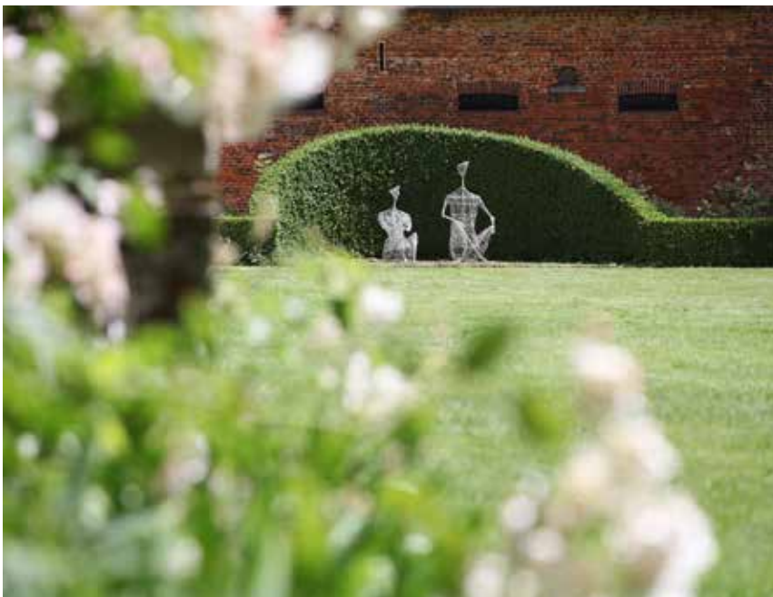
Couple en grillage - Sculpture Jean-Marc de PAS