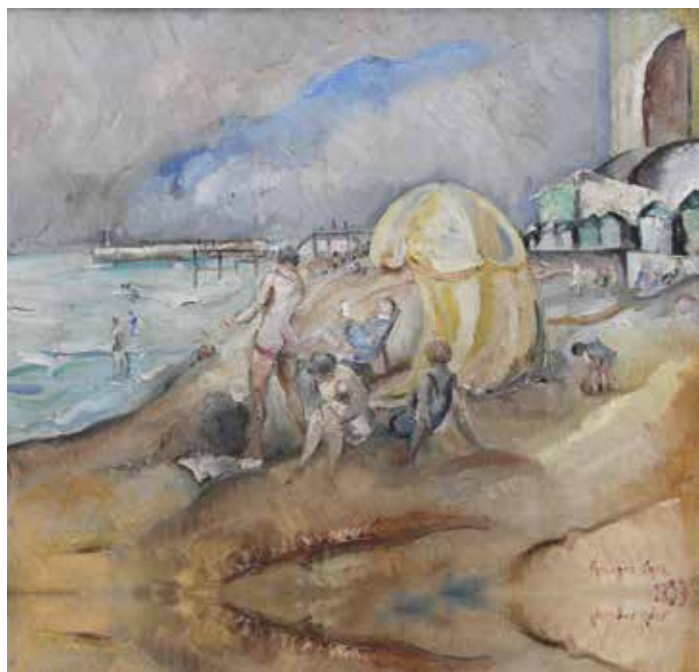
Georges CYR - Baigneuses sur la plage de Fécamp