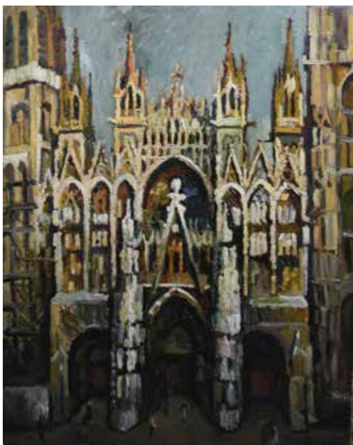
Pierre DUMONT - Cathédrale de Rouen

Exposition à ne pas manquer cet été et cet automne.