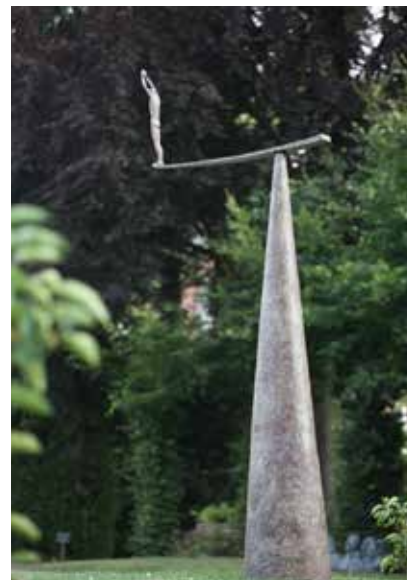
Sculpture André SAUZET - Jardin des sculptures de Bois-Guilbert

Après avoir longtemps réalisé lui-même la fonte de ses bronzes, il confie cette étape à une fonderie. Il effectue lui-même la patine colorée pour donner à ses créations leur aspect de vieux jouet en métal rouillé. En 2012, il crée un espace d'exposition aux Sables d'Olonne. Sa première oeuvre monumentales le plongeur présentée dans le cadre de la 11 e Biennale de sculpture de Bois-Guilbert et des oeuvres d'intérieur à découvrir.