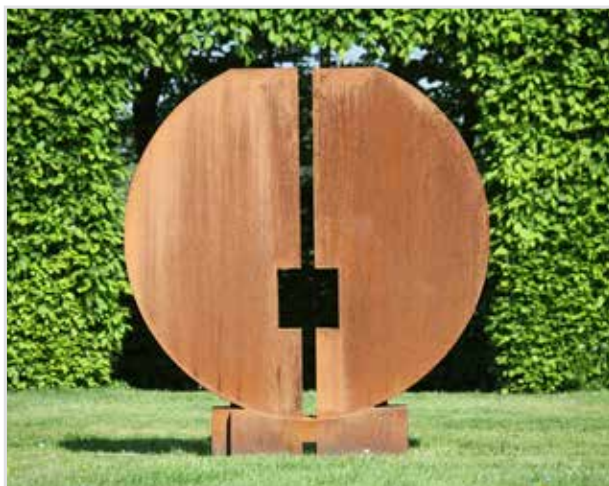
Sculpture Francesco MARINO DI TEANA · Jardin des sculptures de Bois-Guilbert