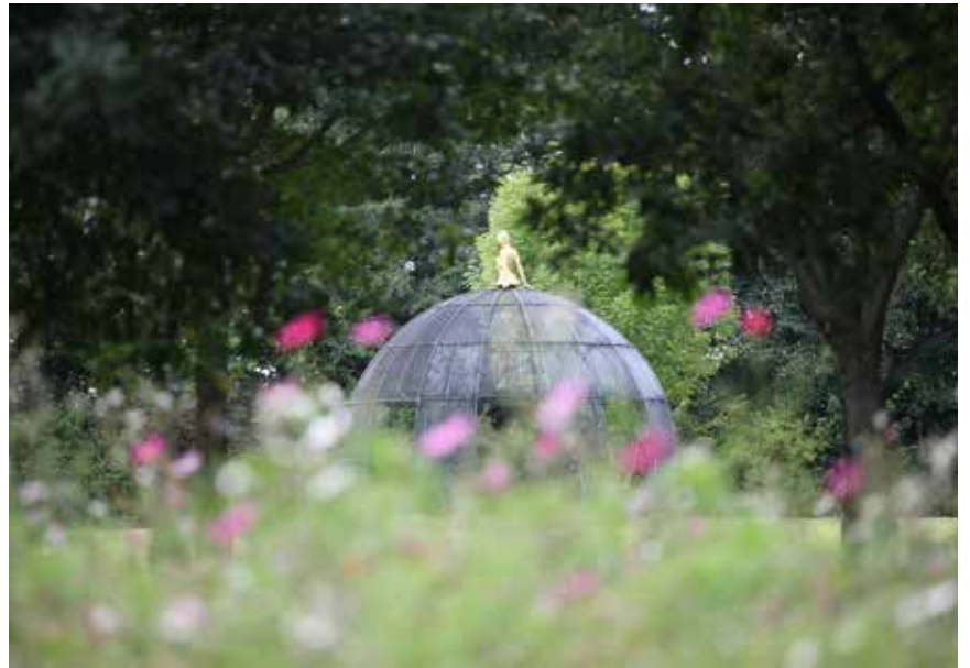
Gaia la Terre - Sculpture Jean-Marc de PAS