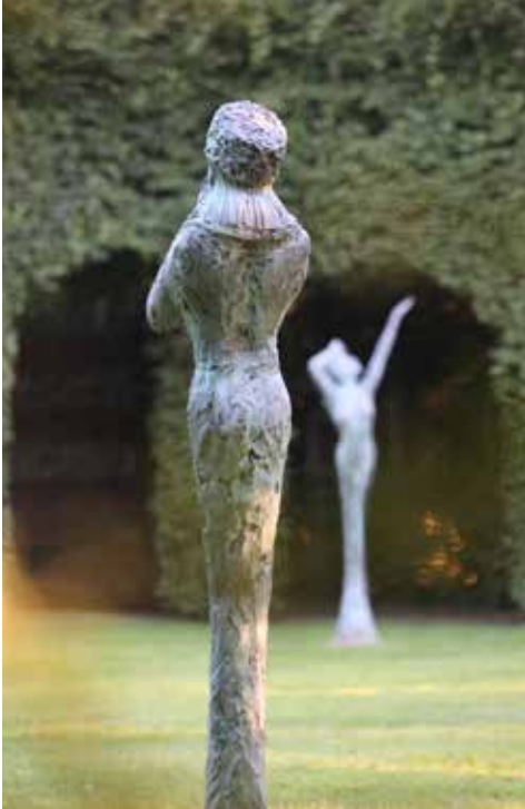
Femmes aux oiseaux - Sculpture Jean-Marc de PAS