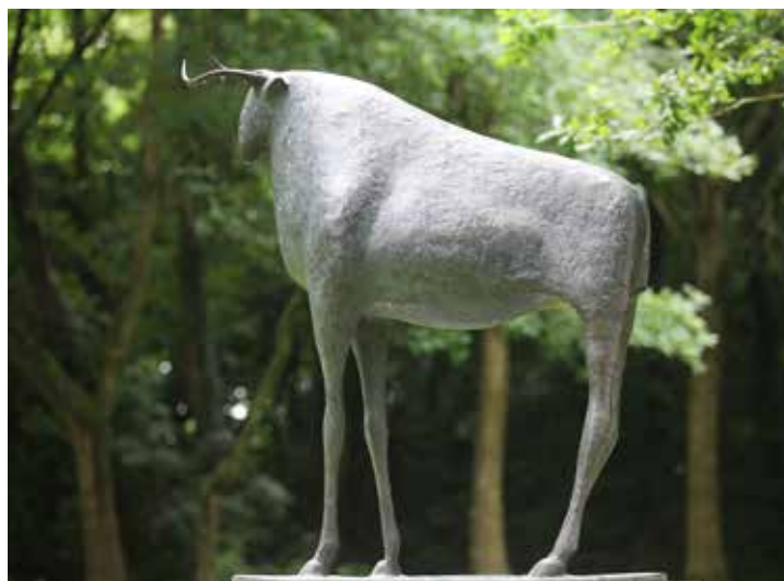
Sculpture Pierre YERMIA - Jardin des sculptures de Bois-Guilbert

Autre fidèle des lieux, Pierre Yermia expose habituellement ses oeuvres monumentales dans le jardin. Cette année, plusieurs sculptures d'intérieur au château.