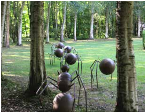
Sculpture Jean-Pierre LARTISIEN · Jardin des sculptures de Bois-Guilbert