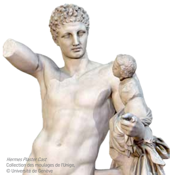
Hermes Plaster Cast Collection des moulages de l'Unige