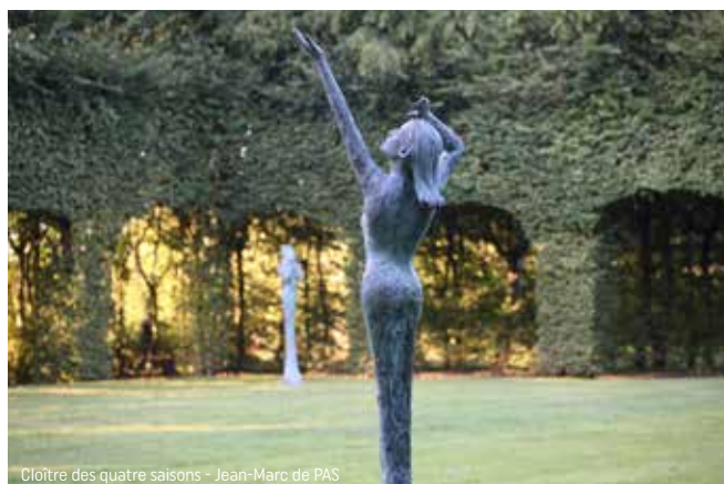
Cloître des quatre saisons - Jean-Marc de PAS