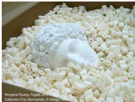
Morgane Fourey, Fragile , 2011 Collection Frac Normandie, © Adago, Paris

Puisant parmi les œuvres de sa collection, le Fonds régional d'art contemporain de Normandie fait résonner les célèbres vers du poème d'Apollinaire, Le Pont Mirabeau , au travers d'une exposition où le temps s'écoule de salle en salle.