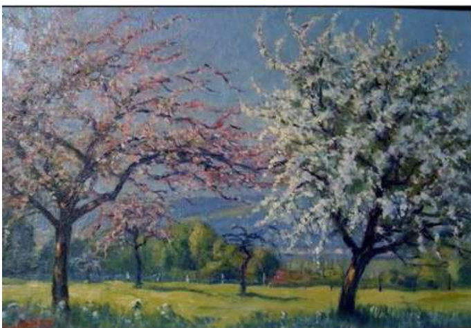
© Guilbert « Pommiers en fleurs » 57 x 74. Coll. part.