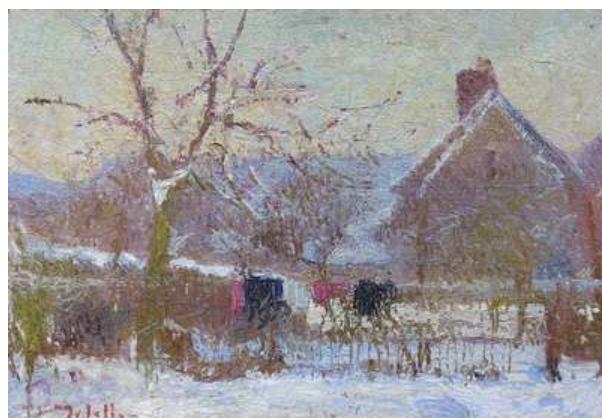
© Delattre, « Le jardin du peintre sous la neige », 1905, 27 x 38. Coll. part.

A chacun sa manière de souligner la finesse des nuances, l'audace des touches colorées, l'abondance des fleurs, la ronde des saisons, les jeux de lumière entre les ciels, les feuillages et les sols, et parfois l'esquisse de la présence humaine qui transforme l'espace en lieu de repos et de quiétude.