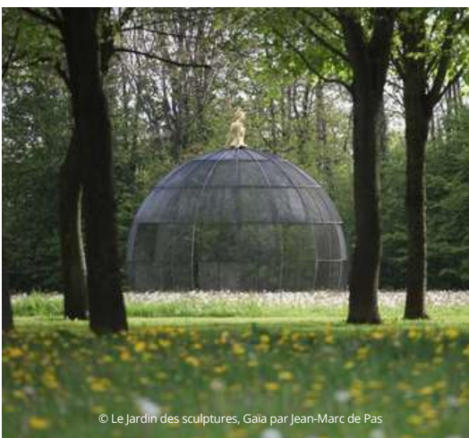
© Le Jardin des sculptures, Gaia par Jean-Marc de Pas

Des hébergements sont proposés sur place : gîte de groupe agréé (28 lits) ainsi que des meublés de tourisme au château (2 à 15 personnes).