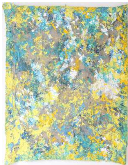
© Caroline Coppey - Froissée n°17, 2017, 167 x 137 cm, huile et acrylique sur toile libre