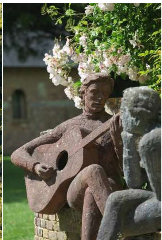
© Le Jardin des sculptures, Guitariiste et Femme assise par Jean-Marc de Pas