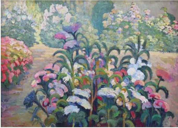
© Dumont « Le jardin », Ca 1906, 68 x 92. Coll. part.