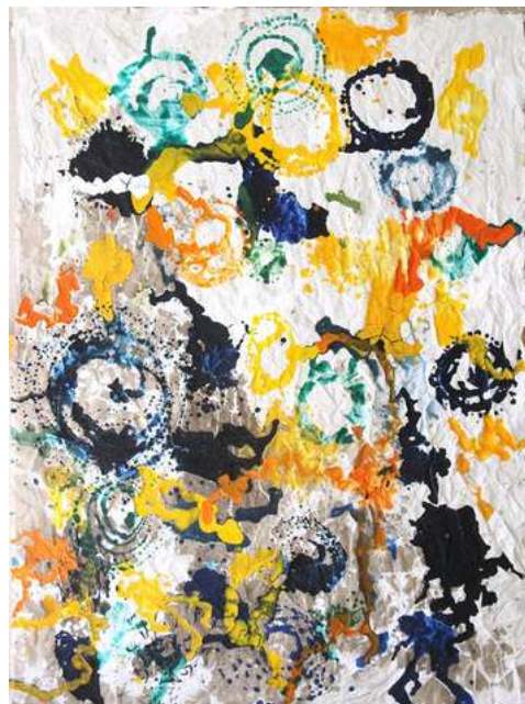
© Caroline Coppey - Coulée n°19, 2025, 140 x 104 cm, huile et acrylique sur toile libre