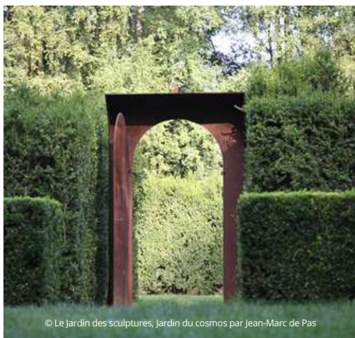
© Le Jardin des sculptures, Jardin du cosmos par Jean-Marc de Pas