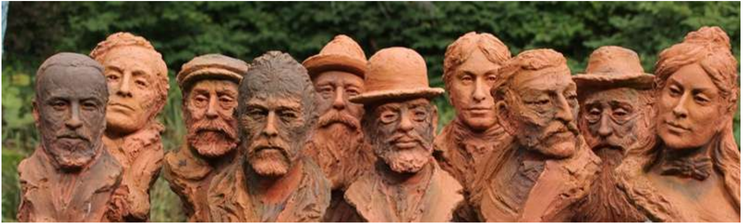
Série des peintres impressionnistes, terres cuites originales (de gauche à droite) : Gustave CAILLEBOTTE, Amedeo MODIGLIANI, Pierre-Auguste RENOIR, Vincent VAN GOGH, Claude MONET, Henri de TOULOUSE-LAUTREC, William TURNER, Paul GAUGUIN, Camille PISSARRO, Berthe MORISOT