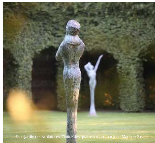
© Le Jardin des sculptures, Cloître des quatre saisons par Jean-Marc de Pas