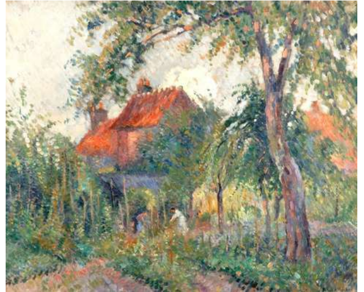
© Pinchon « Dans le jardin », 1935, 60 x 73. Coll. part.