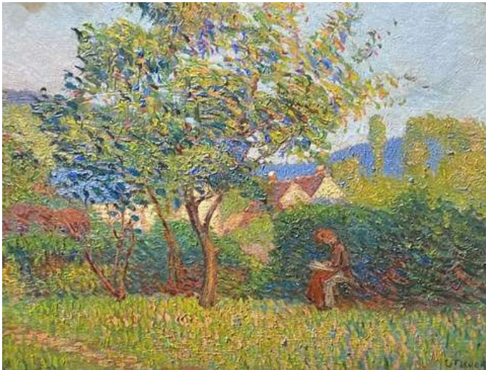
© Tirvert « Jardin à Blainville-Crevon », vers 1909, 54 x 73. Coll. part.