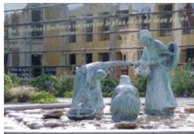
La fontaine des moulières, bronze, Ville de Honfleur