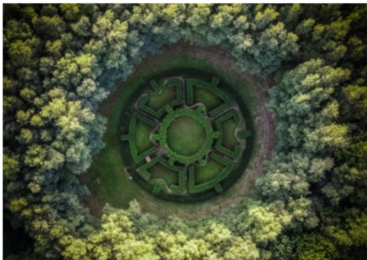
Jardin du cosmos par Jean-Marc de Pas

Labellisé Jardin Remarquable par le Ministère de la Culture, le Jardin est un vaste espace dédié à l'art et à la nature.