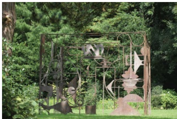
Temple Santa Fiora - Monica Mariniello©Jean-Marc de Pas