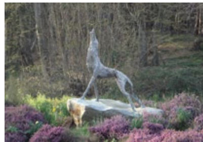
Le Loup, bronze, Ville de Canteleu