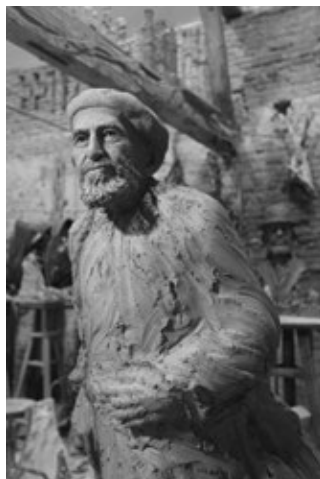
L'abbé Pierre, bronze, Fondation abbé Pierre à Paris