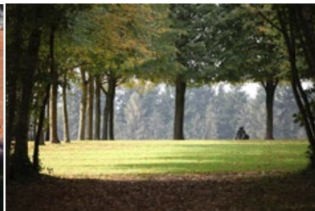
Couple assis • Jean-Marc de Pas