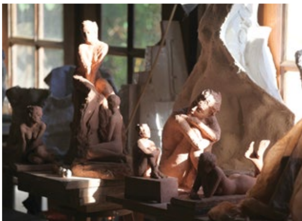
Atelier de Jean-Marc de Pas

• Dates de stage de modelage 2024 (essentiellement nu féminin) :