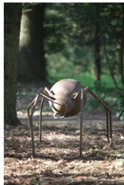
Fourmis géantes - Lartisien©Jean-Marc de Pas

Des temps de visite, de médiation culturelle et des ateliers de création adaptés à tous les publics sont proposés tout au long de l'année : découverte ludique pour les plus jeunes, en petit comité pour les familles ou en stage le week-end pour s'initier au modelage sur modèle vivant.