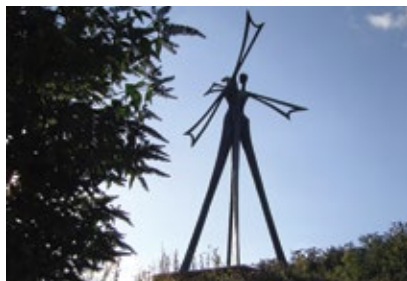
Éole Communauté de communes de Douaisis et Buchy