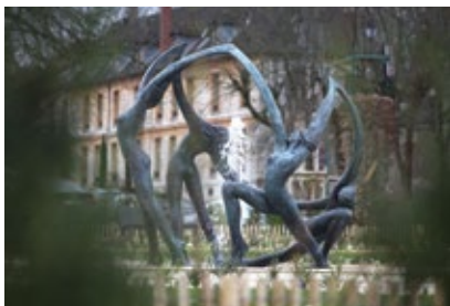
La ronde des quatre saisons, bronze, Ville de Sucy-en-Brie