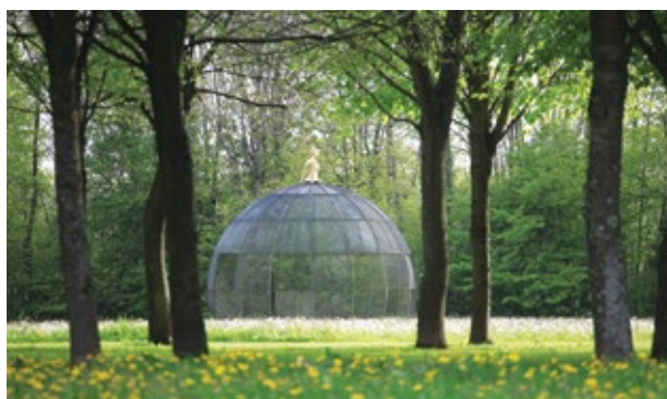
Gaïa • Jean-Marc de Pas

Entrée gratuite pour les moins de 18 ans.