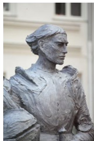
Chevalier Bayard, bronze, Collège Stanislas à Paris