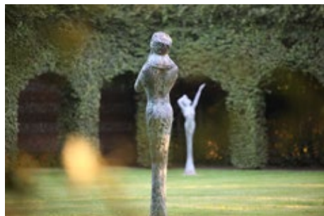
Cloître des quatre saisons • Jean-Marc de Pas

Photographies à votre disposition, libres de droit