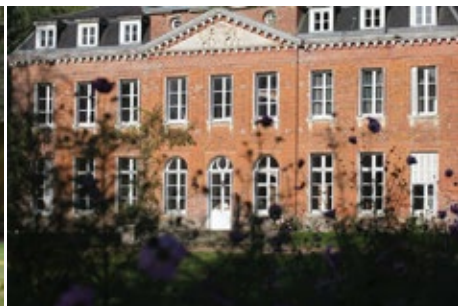
Château de Bois-Guilbert • Jean-Marc de Pas