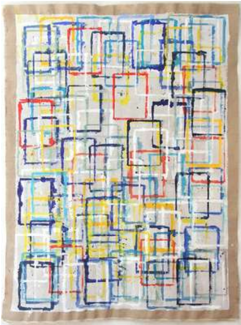
© Caroline Coppey - Sol n°42, 2019, 210 x 156 cm, huile et acrylique sur toile libre