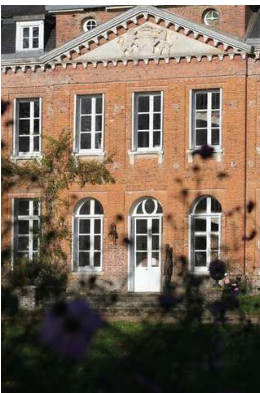
© Château de Bois-Guilbert - Jean-Marc de Pas