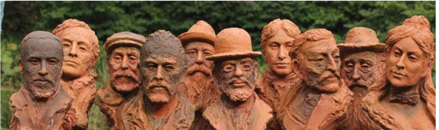
Série des peintres impressionnistes, terres cuites originales (de gauche à droite) : Gustave CAILLEBOTTE, Amedeo MODIGLIANI, Pierre-Auguste RENOIR, Vincent VAN GOGH, Claude MONET, Henri de TOULOUSE-LAUTREC, William TURNER, Paul GAUGUIN, Camille PISSARRO, Berthe MORISOT