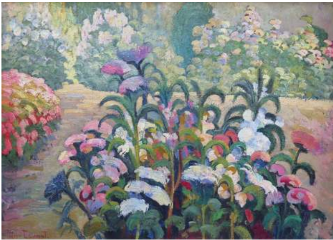
© Dumont « Le jardin », Ca 1906, 68 x 92. Coll. part.