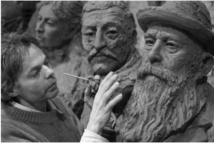
© Jean-Marc de Pas - Série des peintres impressionnistes, création en cours de 2010 à 2013 : Claude MONET