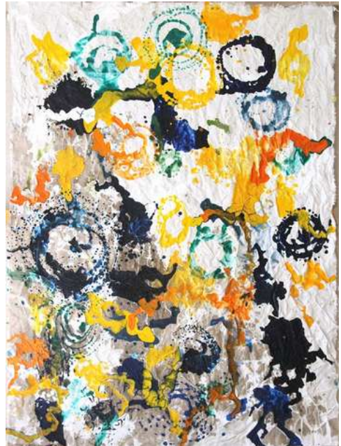
© Caroline Coppey - Coulée n°19, 2025, 140 x 104 cm, huile et acrylique sur toile libre