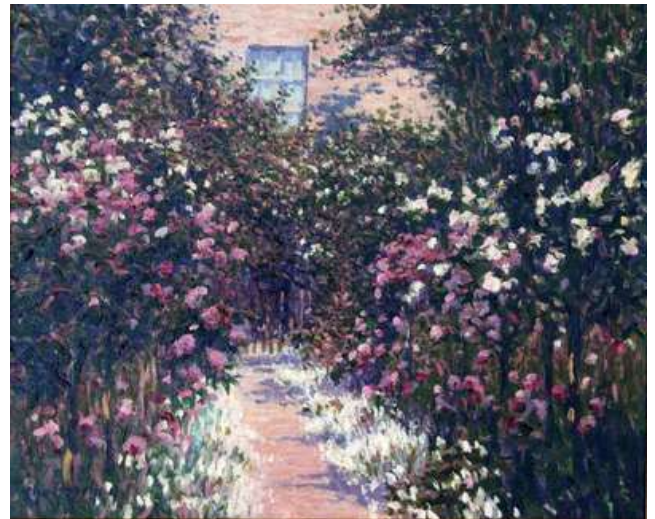
© Frechon « Allée de rosiers-Printemps » Ca 1908, 60 x 73. Coll. part.