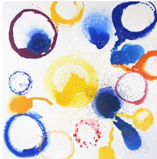
© Caroline Coppey - Couleurs n°103, 2022, 150 x 148 cm, huile et acrylique sur toile