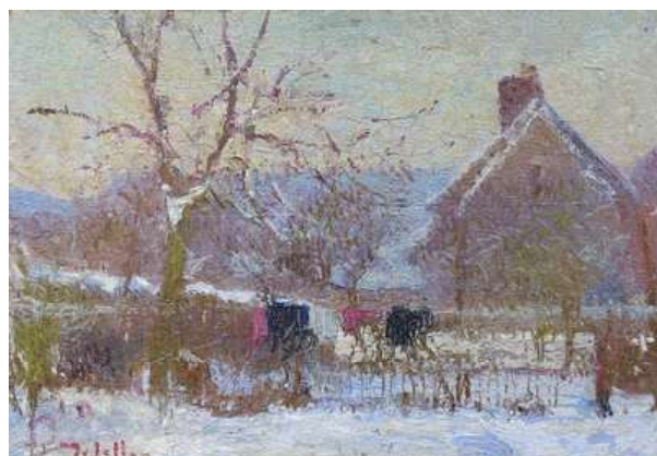
© Delattre, « Le jardin du peintre sous la neige », 1905, 27 x 38. Coll. part.

A chacun sa manière de souligner la finesse des nuances, l'audace des touches colorées, l'abondance des fleurs, la ronde des saisons, les jeux de lumière entre les ciels, les feuillages et les sols, et parfois l'esquisse de la présence humaine qui transforme l'espace en lieu de repos et de quiétude.