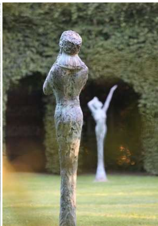
© Le Jardin des sculptures, Cloître des quatre saisons par Jean-Marc de Pas