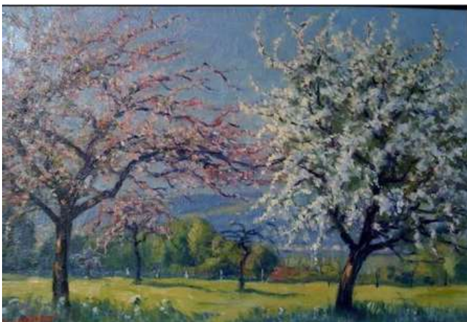
© Guilbert « Pommiers en fleurs » 57 x 74. Coll. part.