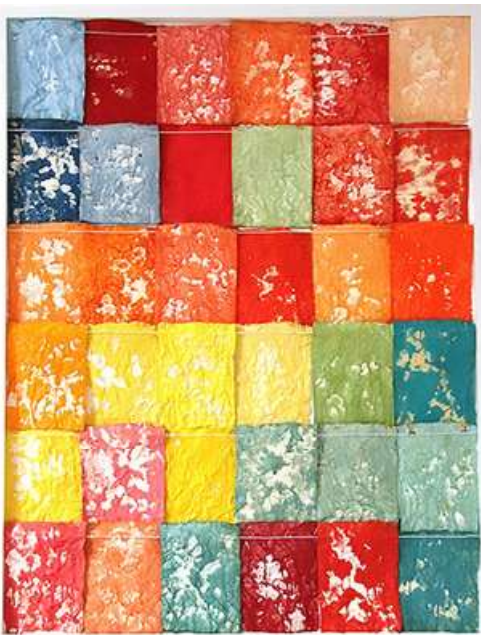
© Caroline Coppey - 36 Tissus n°3, 2023, 122,5 x 93,5 cm, huile et acrylique sur toile libre, fil de fer, épingles et bois