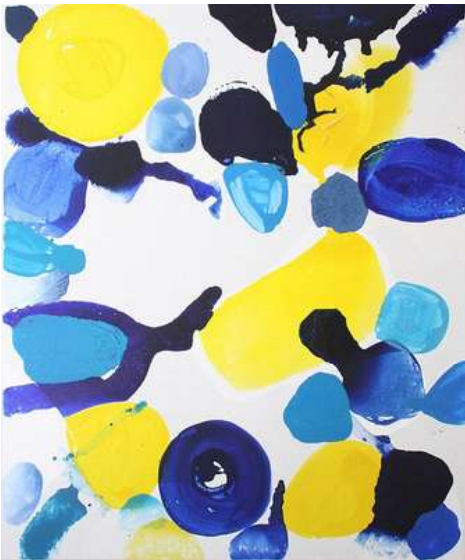
© Caroline Coppey - P. 1478 (A Djuna Barnes), 2019, 166 x 138 cm, huile et acrylique sur toile