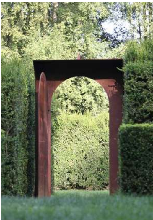
© Le Jardin des sculptures, Jardin du cosmos par Jean-Marc de Pas