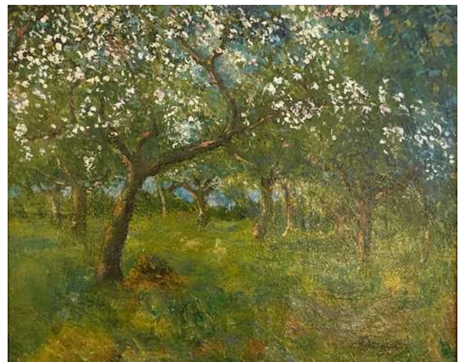
© Hodé « Pommiers en fleurs », Ca 1913, 50 x 65. Coll. part.