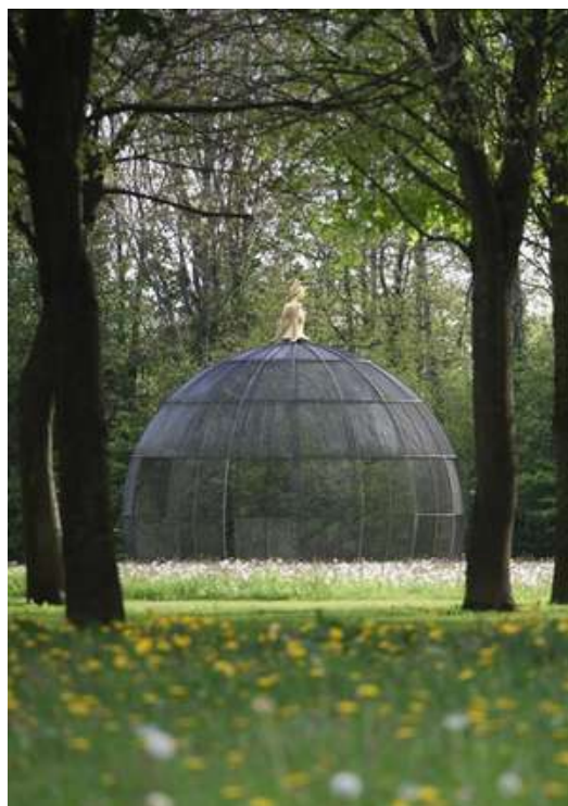
© Le Jardin des sculptures, Gaïa par Jean-Marc de Pas

Des hébergements sont proposés sur place : gîte de groupe agréé (28 lits) ainsi que des meublés de tourisme au château (2 à 15 personnes).