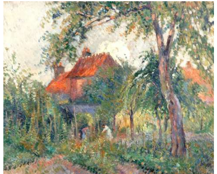
© Pinchon « Dans le jardin », 1935, 60 x 73. Coll. part.