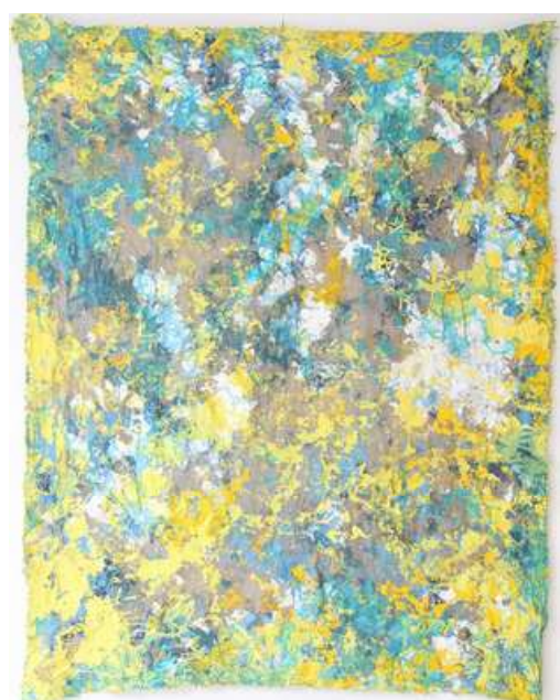
© Caroline Coppey - Froissée n°17, 2017, 167 x 137 cm, huile et acrylique sur toile libre