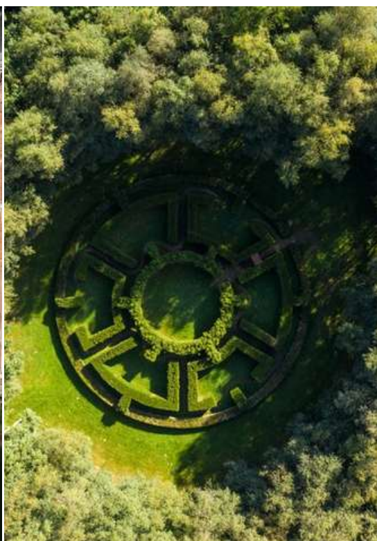
© Le Jardin des sculptures, Jardin du cosmos Jean-Marc de Pas