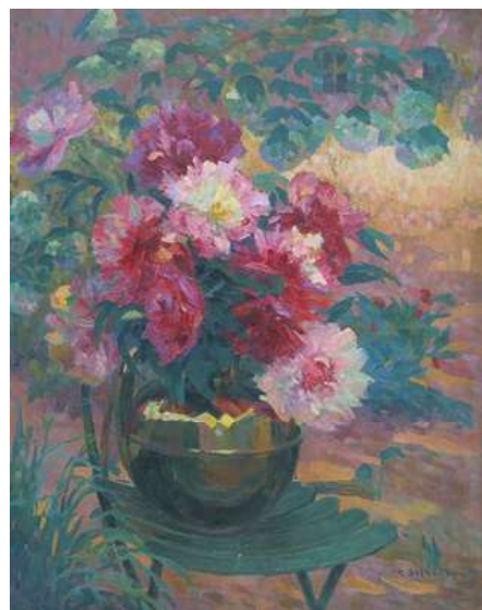
© Delaunay « La canne à lait » 100 x 81. Coll. part.

L'exposition « Les Jardins impressionnistes de l'École de Rouen » offre une occasion privilégiée de découvrir ces artistes à travers des œuvres issues de collections particulières, pour la plupart inédites et méconnues du grand public. Les dix peintres et les vingt-sept tableaux retenus sont emblématiques de la richesse de cette école et de sa grande qualité picturale : Léonard Bordes (1898-1969), Marcel Couchaux (1877-1939), Joseph Delattre (1858-1912), Marcel Delaunay (1876-1959), Pierre Dumont (1884-1936), Charles Frechon (1856-1929), Narcisse Guilbert (1878-1942), Pierre Hodé (1889-1942), Robert-Antoine Pinchon (1886-1943), Eugène Tirvert (1881-1948).